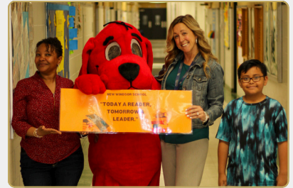
NWS: D.E.A.R. CON CLIFFORD 14-04-2026