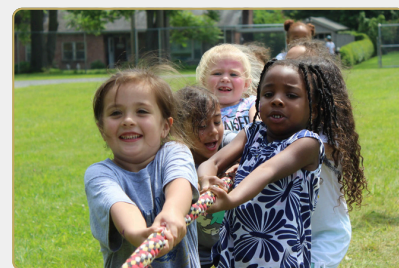
NWS: DÍA DE CAMPO 2018-2019