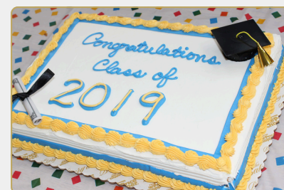
NWS: CEREMONIA DE ASCENSO DE 5.º GRADO