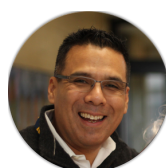
Sr. Cant Director