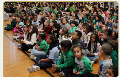
NWS: CELEBRACIONES DEL MES DE LA HISTORIA AFROAMERICANA