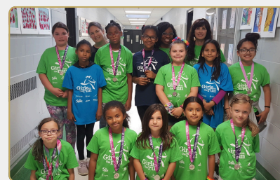
NWS: GIRLS ON THE RUN