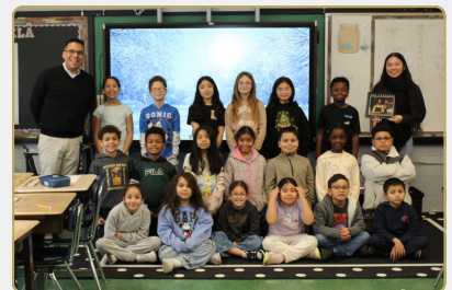
NWS: CONSTRUYENDO PUENTES A TRAVÉS DE LOS LIBROS FEBRERO Y MARZO-2026