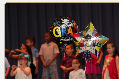
NWS: CEREMONIA DE ASCENSO DE KINDERGARTEN