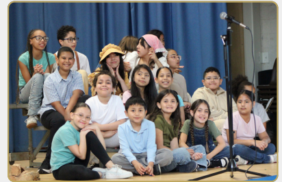
NWS: PRESENTACIÓN DE DRAMA 17-04-2026