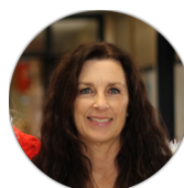
Sra. Caci Psicóloga Escolar